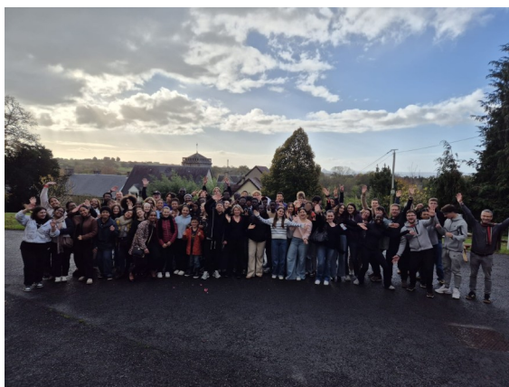
Les jeunes de l'ENORM'KIFF