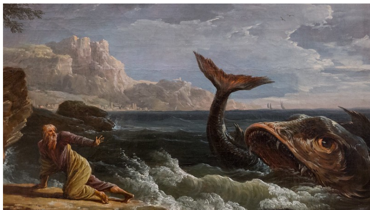
Jonas sortant du ventre de la baleine. Claude-Joseph Vernet (1714-1789). Musée des Beaux-Arts de Lyon

Ventre d'un monstre marin, comme un espace matriciel, comme un lieu de méditation, un lieu de retour sur soi, un lieu de nouvelle naissance. Pour Jonas, tout semblait clair au début de l'histoire. Il lui avait été demandé d'aller à Ninive inviter les habitants de la ville à la conversion. Ninive est, dans l'imaginaire de l'époque, la capitale des conquérants à la réputation de cruauté et de férocité extrême. Aussi, à peine Jonas a-t-il entendu l'appel qu'il part en bateau de l'autre côté, « pour échapper au Seigneur » précise le texte biblique. Une tempête terrible l'amène à être jeté à la mer où le grand poisson le recueille pour aller le déposer trois jours et trois nuits plus tard sur une plage. Après ces trois jours et trois nuits, voici notre prophète prêt à entendre l'appel de Dieu et à y répondre.