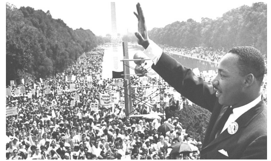
Washington DC, 28 août 1963

FLASHMOB sur la place Martin-Luther-King devant le temple.