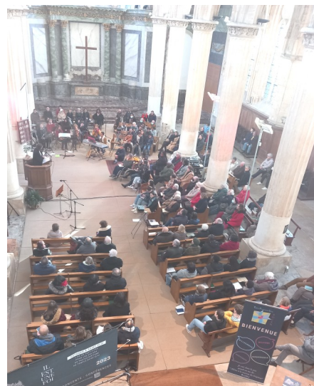
Culte à Saint-Eloi, le 15 janvier

En ce mois de mars, nous avons quitté « les rivages tranquilles d'une appartenance acquise, pour devenir témoins ». Plusieurs de nos voyages ont rencontré un succès indéniable et nous ont interpellé, non seulement par leur fréquentation mais aussi par la qualité des intervenants.es et des artistes qui se sont mobilisés. Nombre des personnes présentes ont pu découvrir le temple pour la première fois et saluer nos initiatives. Un grand merci à toutes celles et ceux qui se sont mobilisés dans la prière ou l'action pour permettre ces réussites, membres de la paroisse ou d'associations partenaires.